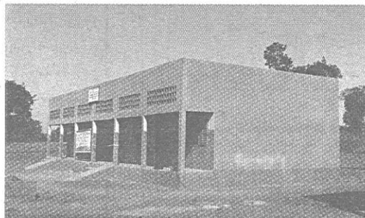
L'offre éducative burkinabè se trouve renforcée par la réalisation de ces infrastructures scolaires