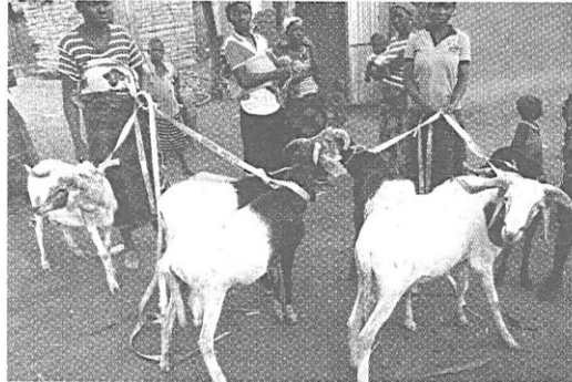
Des moutons pour une meilleure autonomisation financière des femmes ...

Les femmes le plus souvent, en zones rurales, dépendent économiquement de