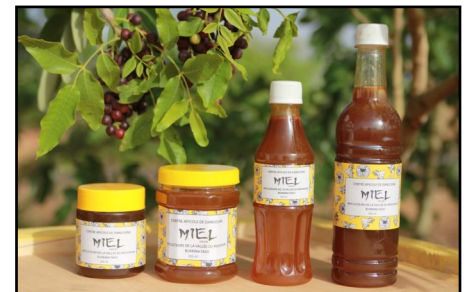
Nouvelles images des produits du karité et du miel