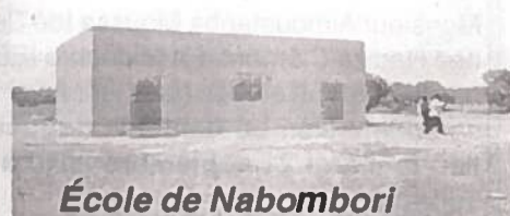
École de Nabombori

dans 20 villages. Elle a laissé sur ses pas de nombreux kits scolaires. Dans les mois à venir, la Fondation SEMAFO remettra officiellement aux autorités nigériennes, plusieurs salles de classe et écoles qu'elle a construites mais qui seront à l'entière disposition de l'école nigérienne et donc de l'Etat.