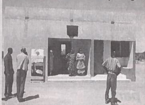
La case de santé de Bossey Bangou

ture où les femmes commercialisent déjà les produits de leur savoir faire tout en initiant leurs jeunes sœurs au métier de la couture. Elle a aussi échangé avec le Chef du village. La Directrice générale de SEMAFO a distribué 258 boîtes de dons