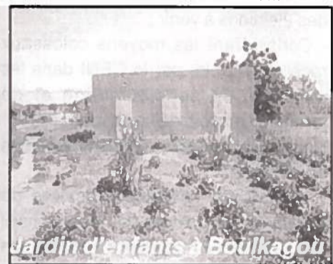
Jardin d'enfants à Boukagou

ture où les femmes commercialisent déjà les produits de leur savoir faire tout en initiant leurs jeunes sœurs au métier de la couture. Elle a aussi échangé avec le Chef du village. La Directrice générale de SEMAFO a distribué 258 boîtes de dons